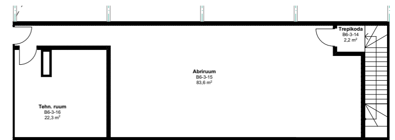
BÜROO 6 III k 108,1 m 2